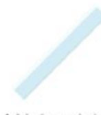
1 règle plate en plastique 30 cm